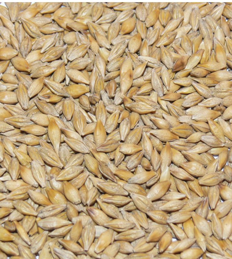
Plonowanie (średnia BSA 2008-2012 skala 9 pkt.)